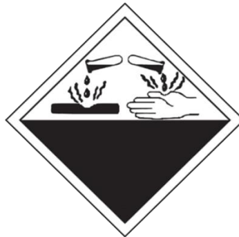
BAHAN MENGAKIS CORROSIVE SUBSTANCES (WASTE)