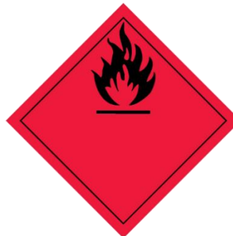
CECAIR MUDAH TERBAKAR INFLAMMABLE LIQUIDS (WASTE)