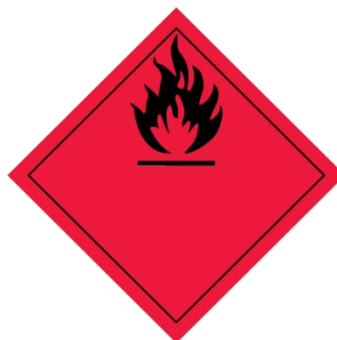
CECAIR MUDAH TERBAKAR INFLAMMABLE LIQUIDS (WASTE)