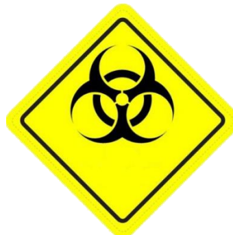
BAHAN BERJANGKIT INFECTIOUS SUBSTANCES (WASTE)