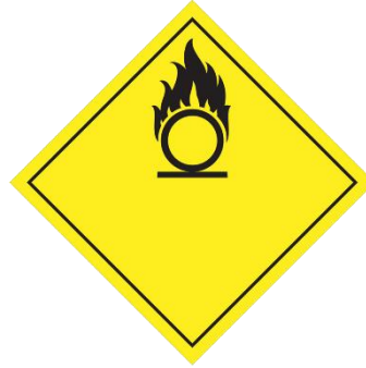
BAHAN PENGOKSIDAAN OXIDIZING SUBSTANCES (WASTE)