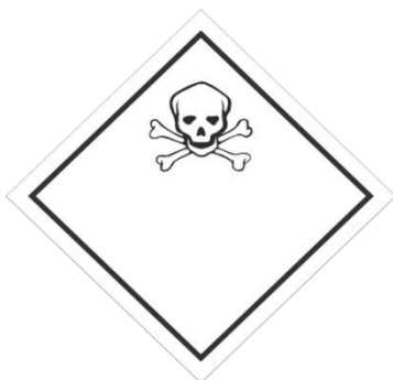
BAHAN TOKSIK TOXIC SUBSTANCE (WASTE)