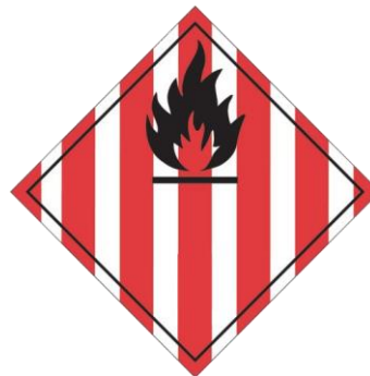
PEPEJAL MUDAH TERBAKAR INFLAMMABLE LIQUIDS (WASTE)