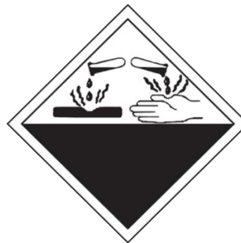
BAHAN MENGAKIS CORROSIVE SUBSTANCES (WASTE)