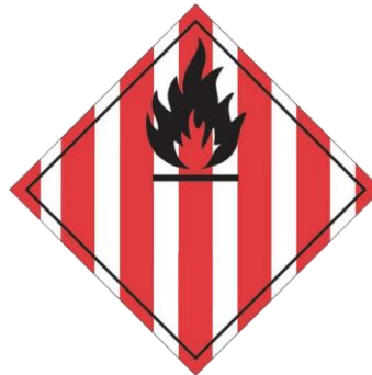
PEPEJAL MUDAH TERBAKAR INFLAMMABLE LIQUIDS (WASTE)