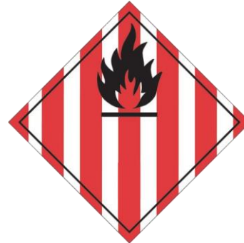
PEPEJAL MUDAH TERBAKAR INFLAMMABLE LIQUIDS (WASTE)