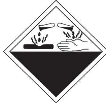
BAHAN MENGAKIS CORROSIVE SUBSTANCES (WASTE)